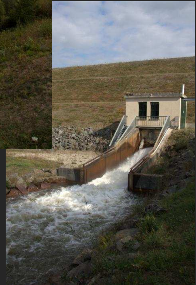
Etang de Miallet