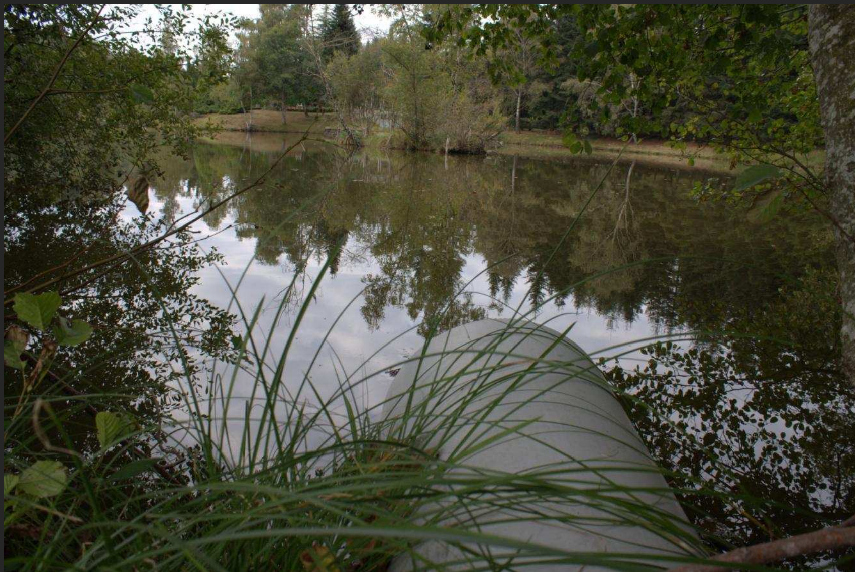
Sources de la Dronne