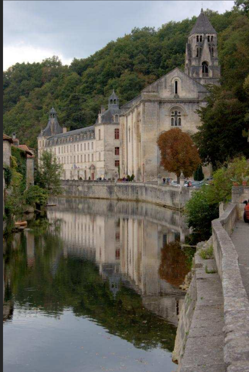
La Dronne à Brantôme