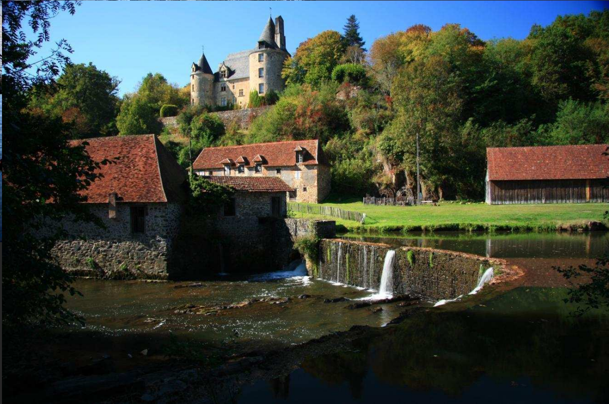
Forges de Savignac-Lédrier sur l'Auvézère