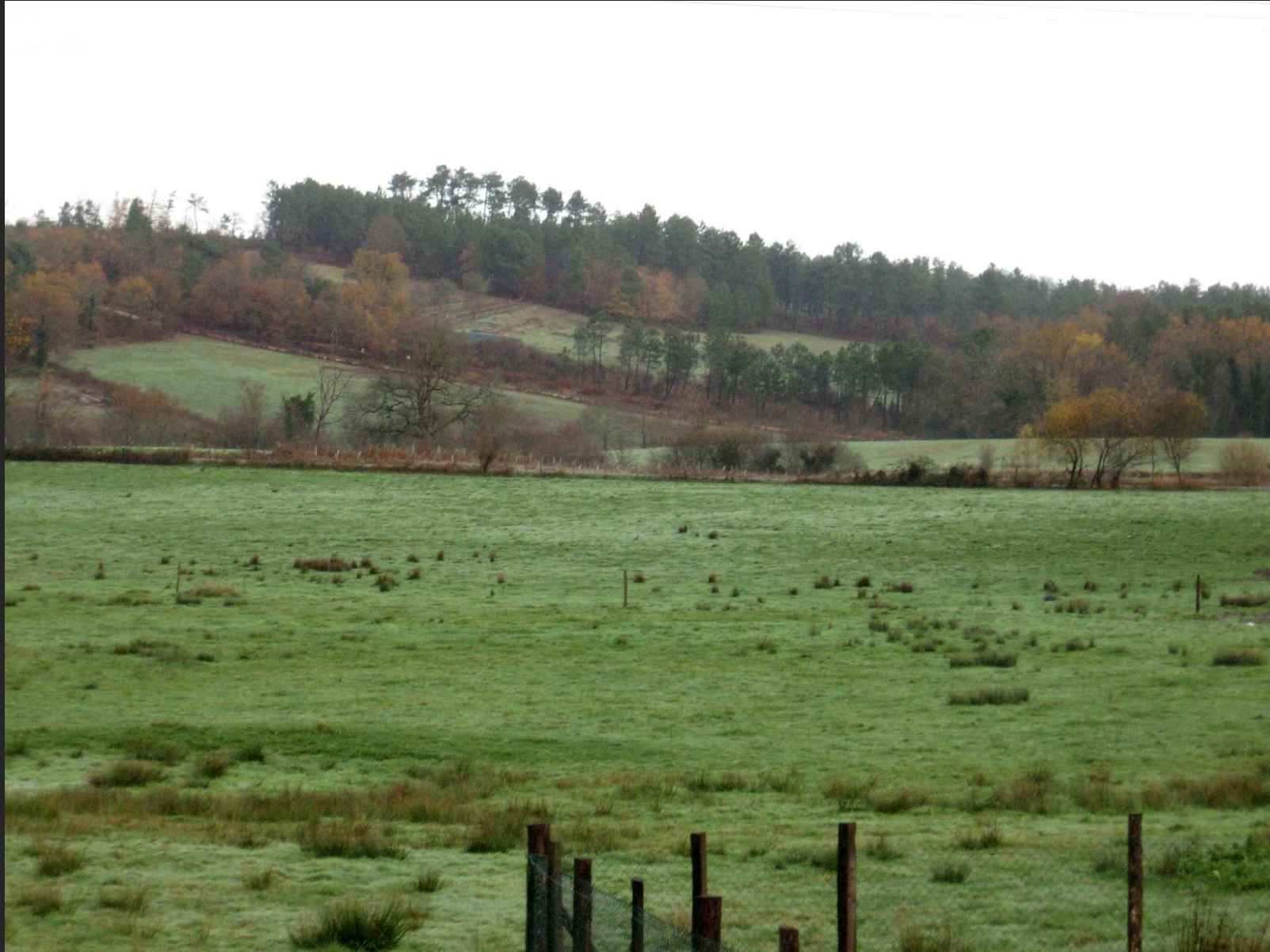
Bassin de la Dronne entre la Roche-Chalais et Saint Aulaye