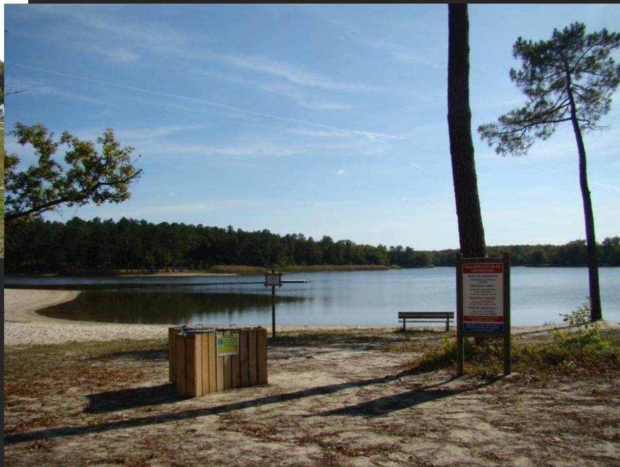
L'étang de la Jemaye