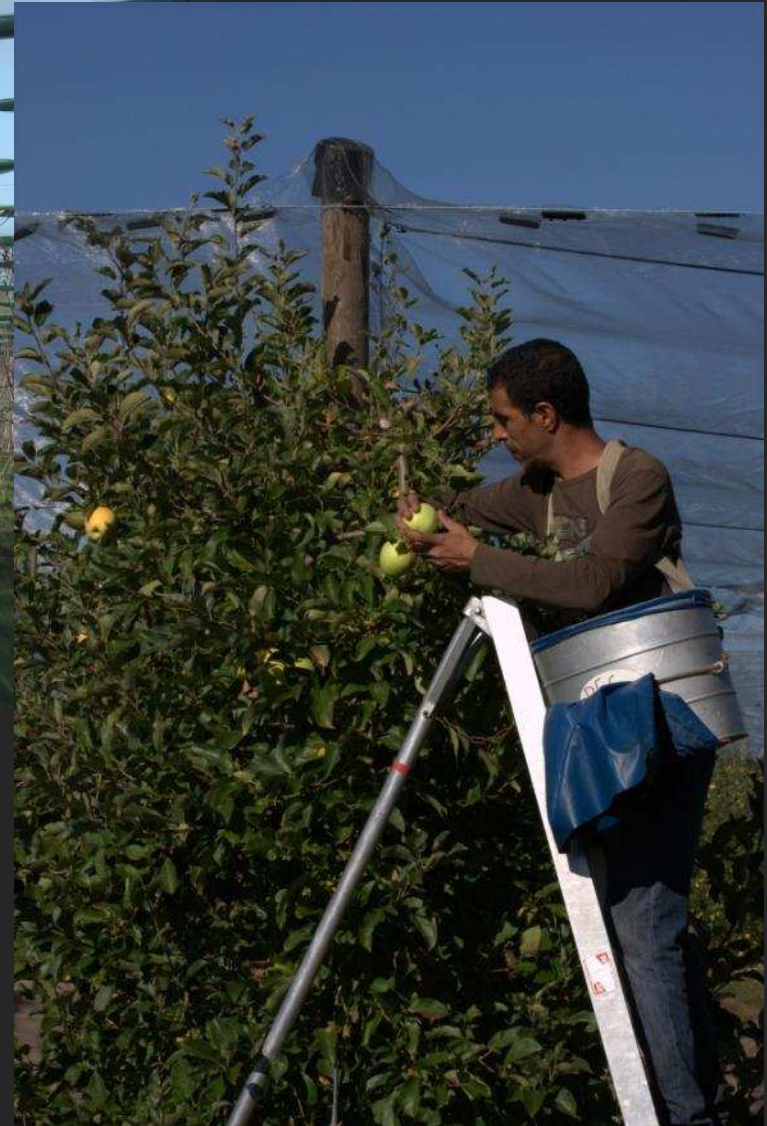
Arboriculture à l'amont du bassin Isle-Dronne