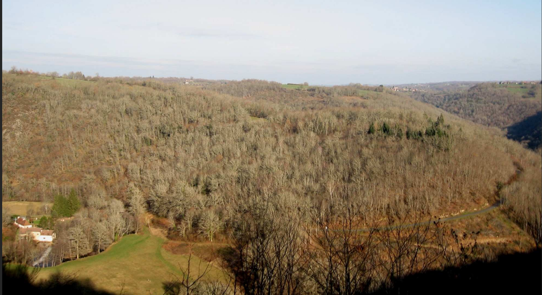
Site du Pervendoux sur l'Auvézère