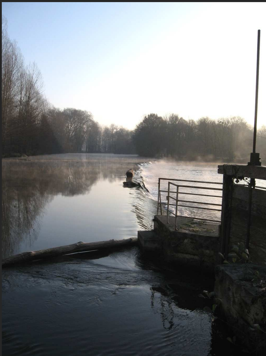
L'Isle à Trelissac