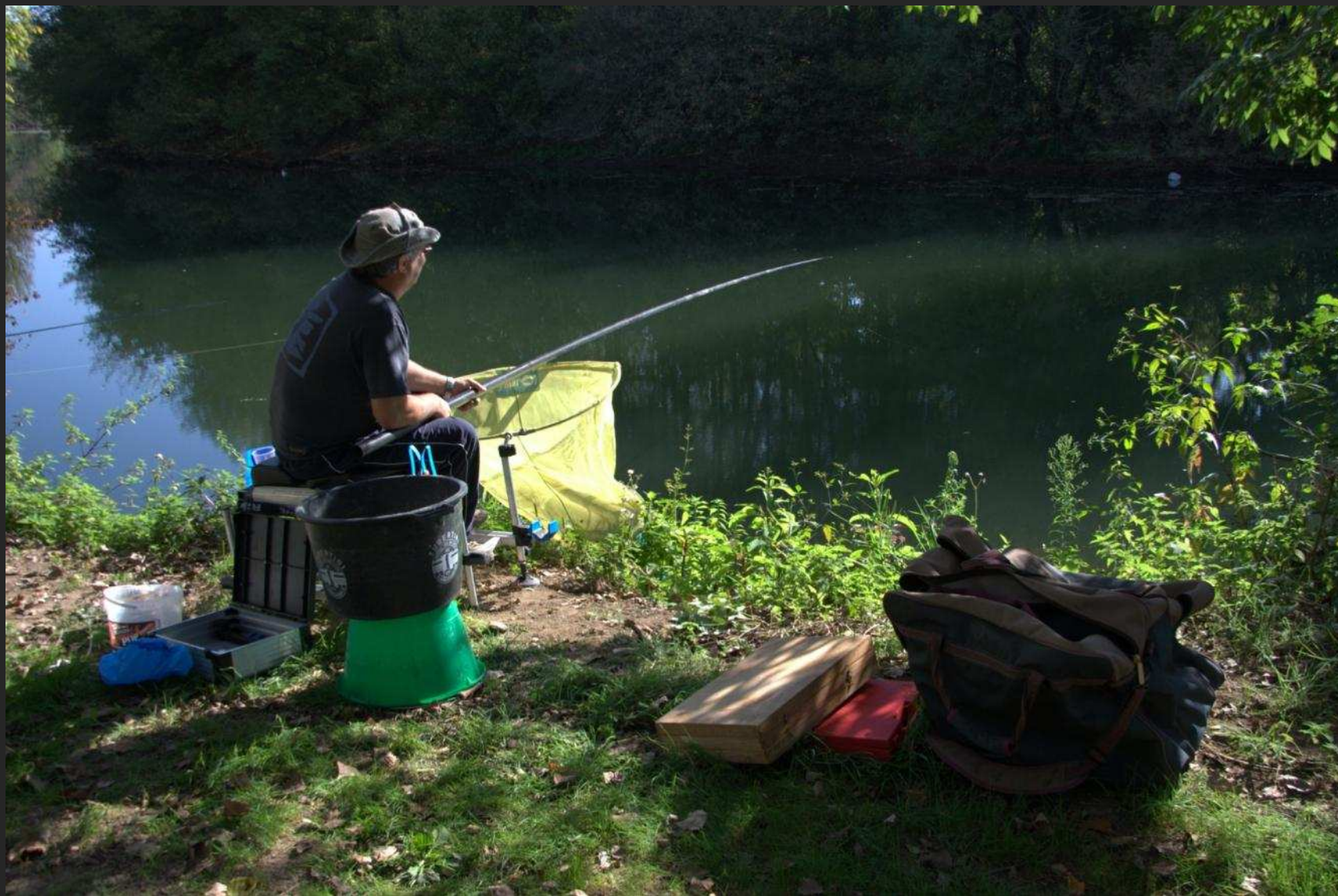
Pêcheur sur l'Isle