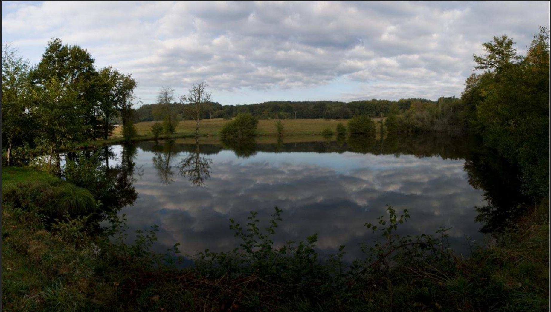
Etang sur l'Isle amont