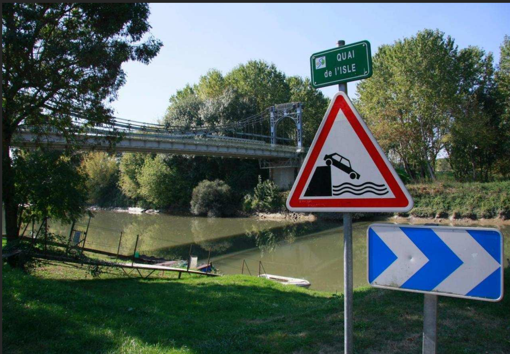
L'Isle à Saint Denis de Pile