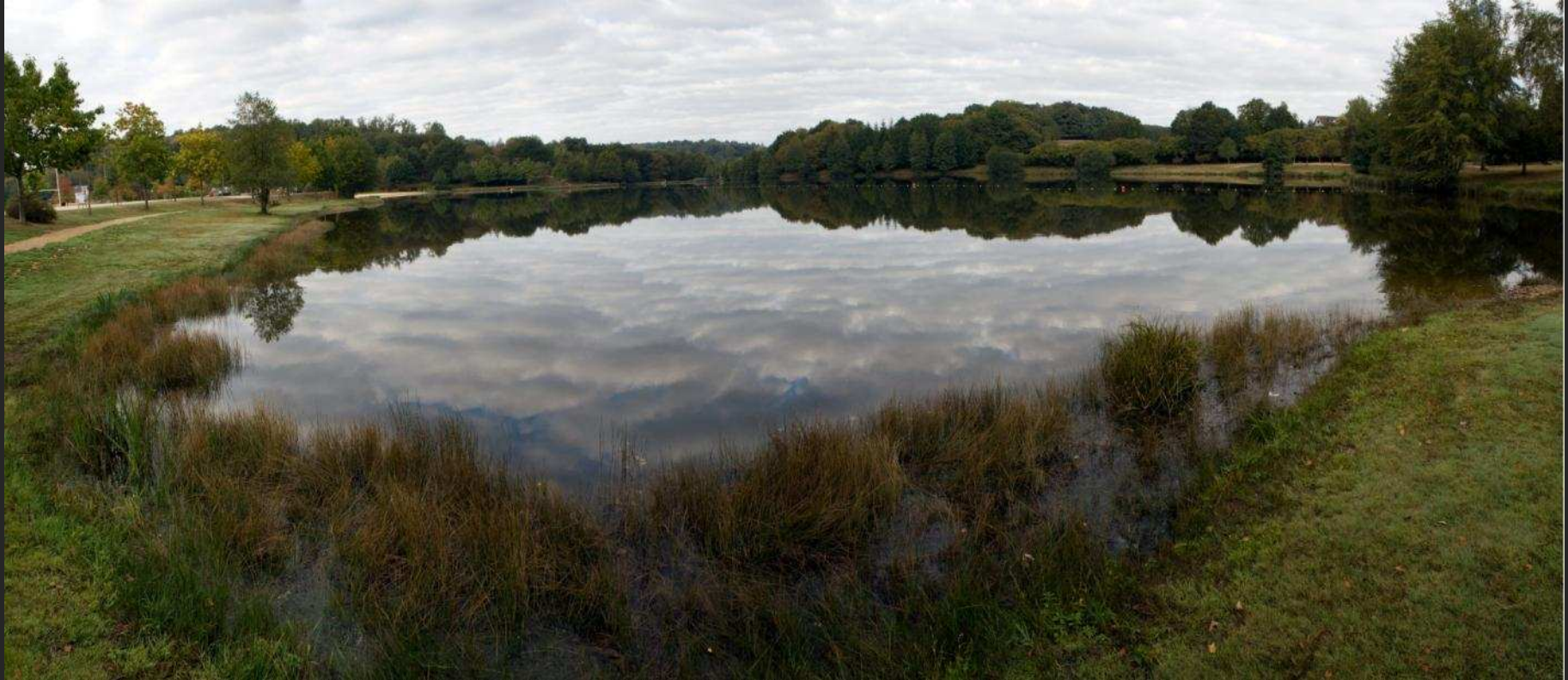
Etang sur la Dronne amont