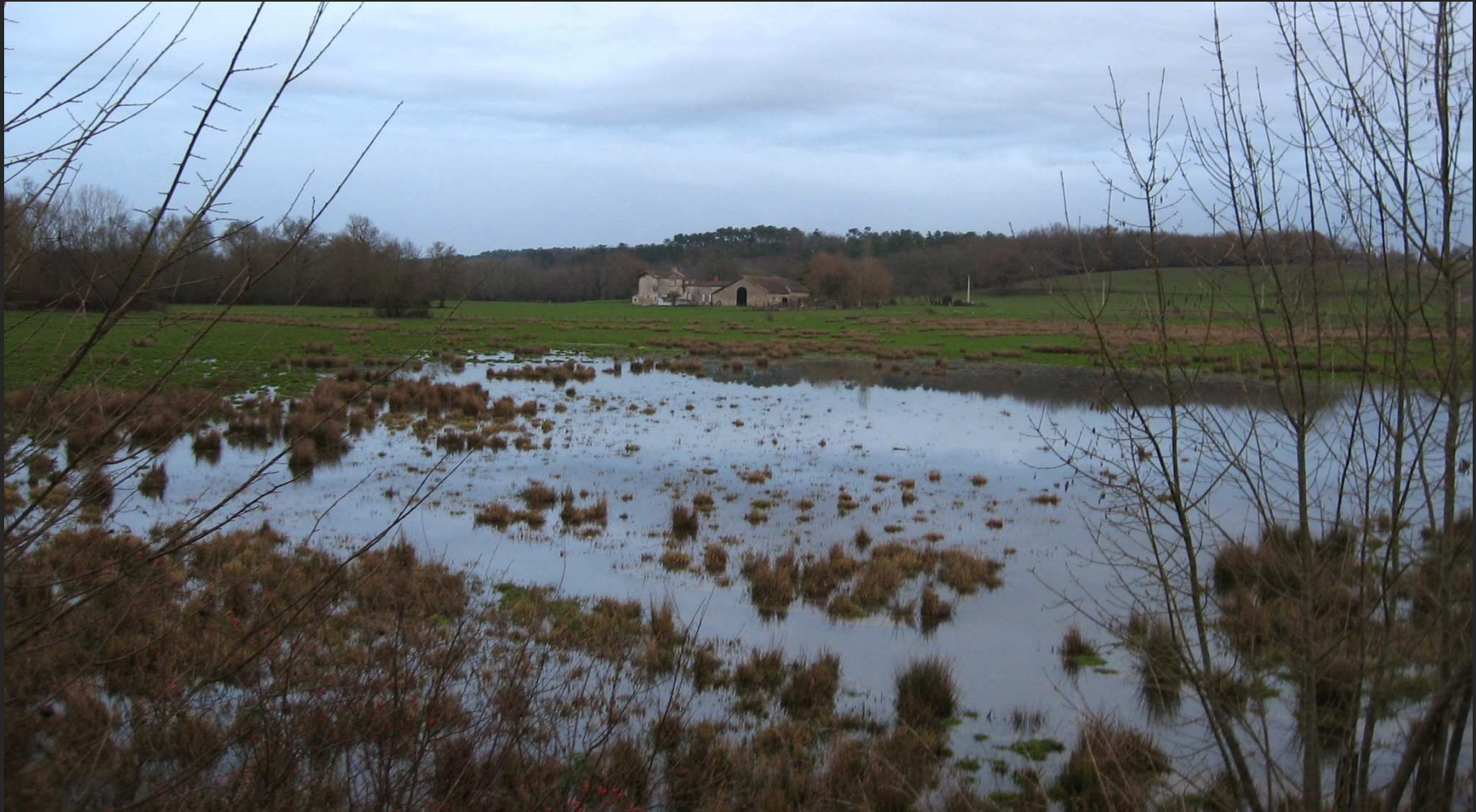
Zone humide à l'aval du Lary-Palais