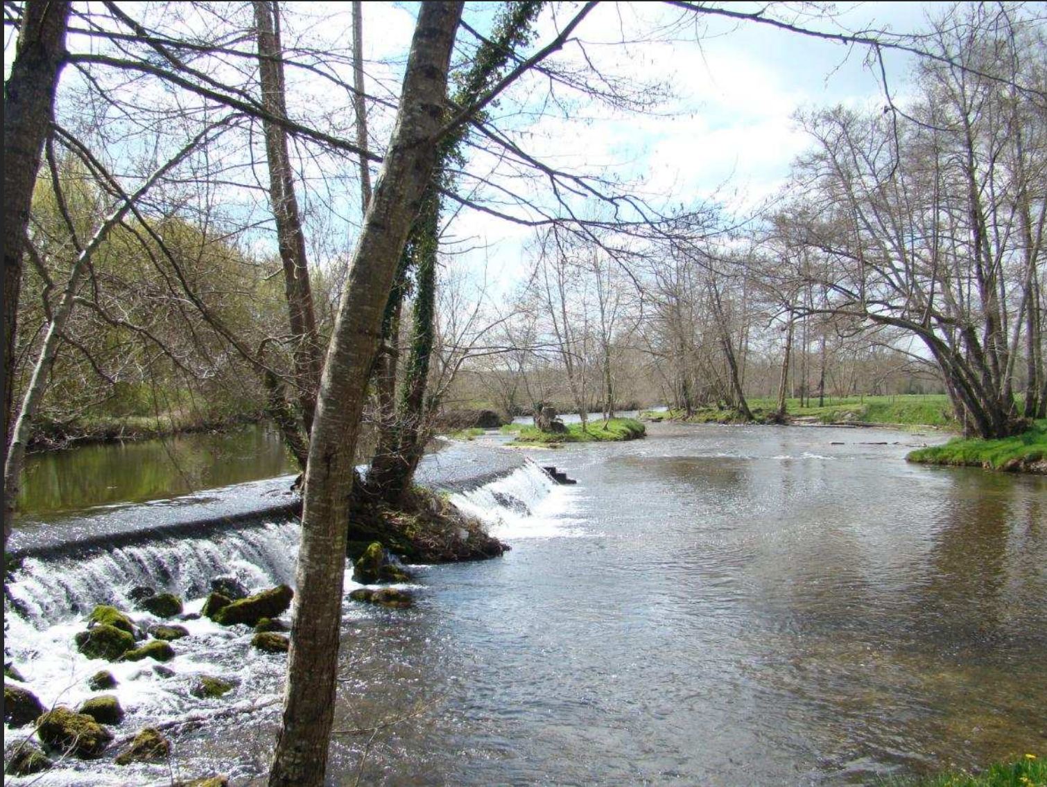
La Dronne à Saint Méard de Dronne