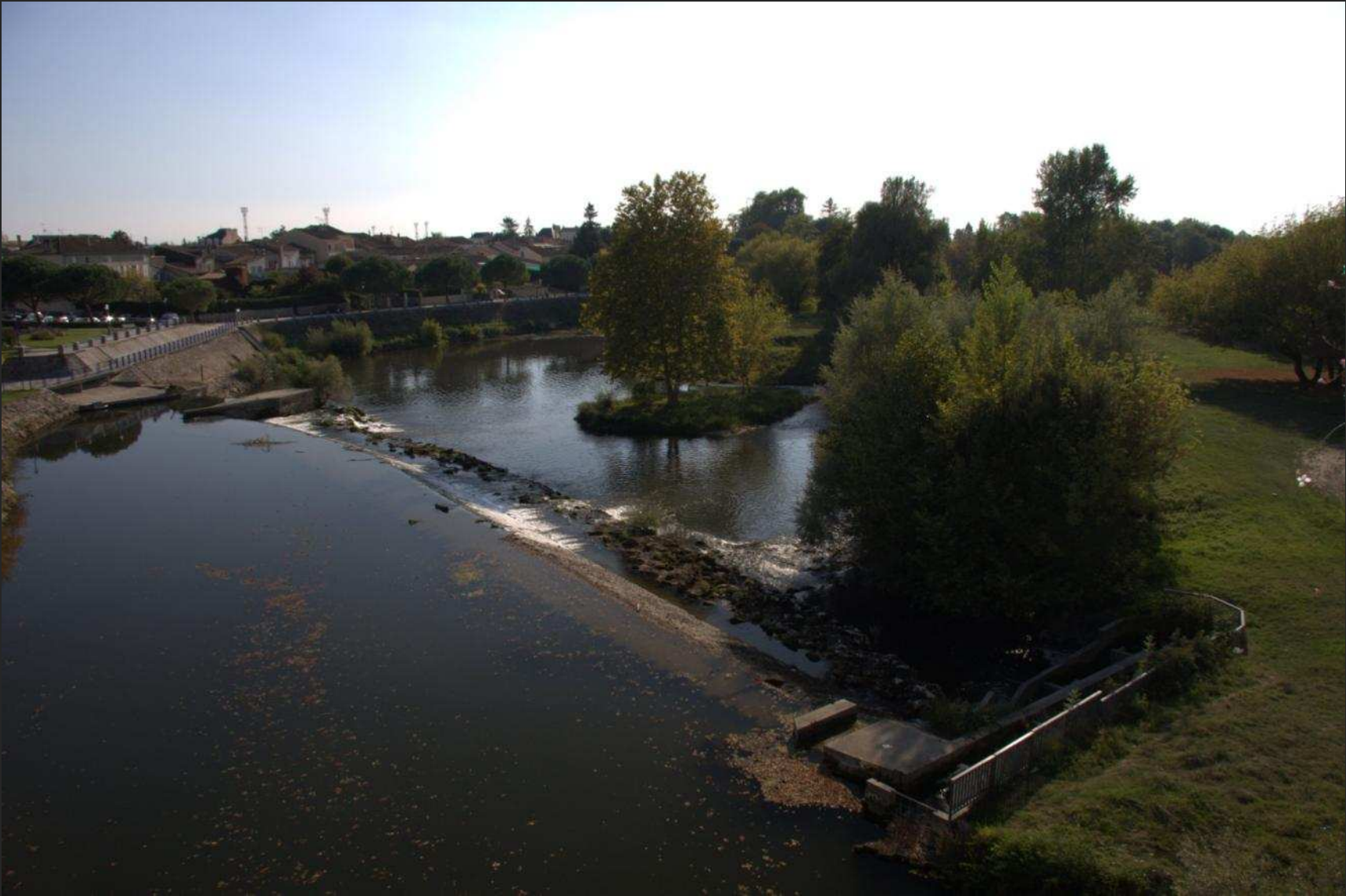
L'Isle à Coutras