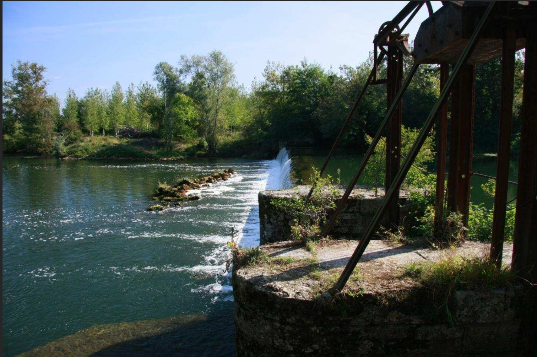
L'Isle à Saint Martial d'Artenset