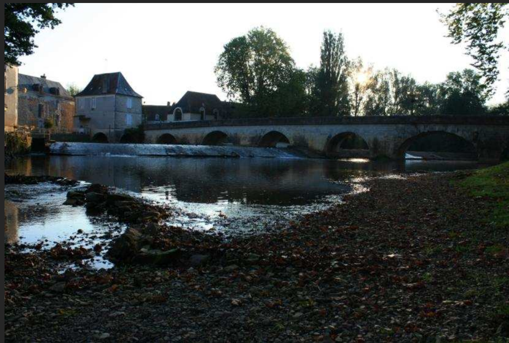
L'Auvézère en aval de Saint-Mesmin et à Cubjac