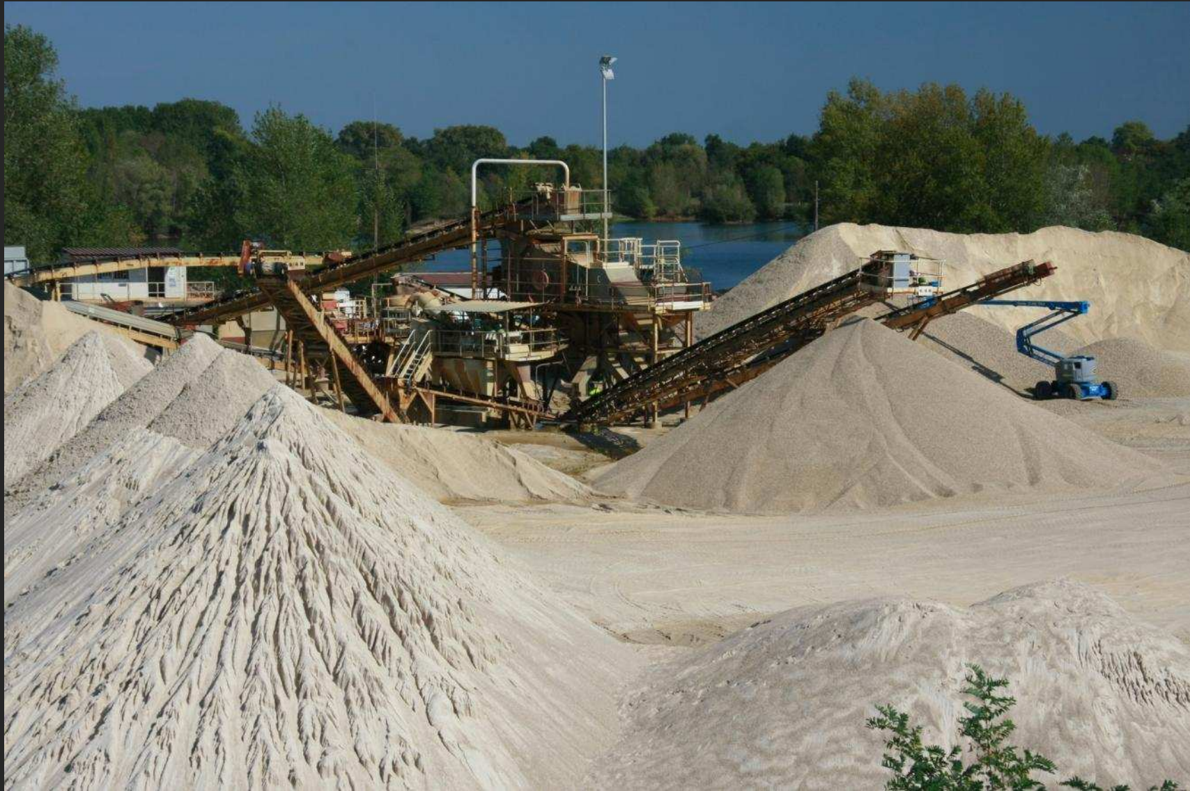
Sablère sur l'Isle aval