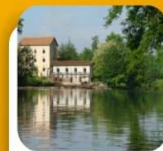
SCHÉMA D'AMÉNAGEMENT ET DE GESTION DES EAUX