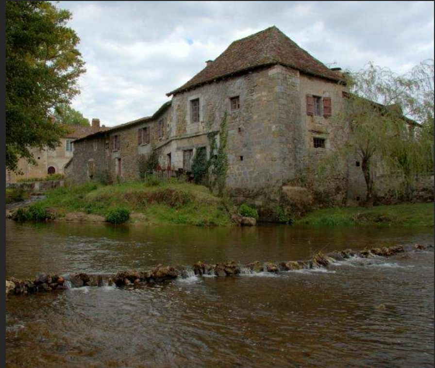
La Dronne à Bussière-Galant et Saint Jean de Côle