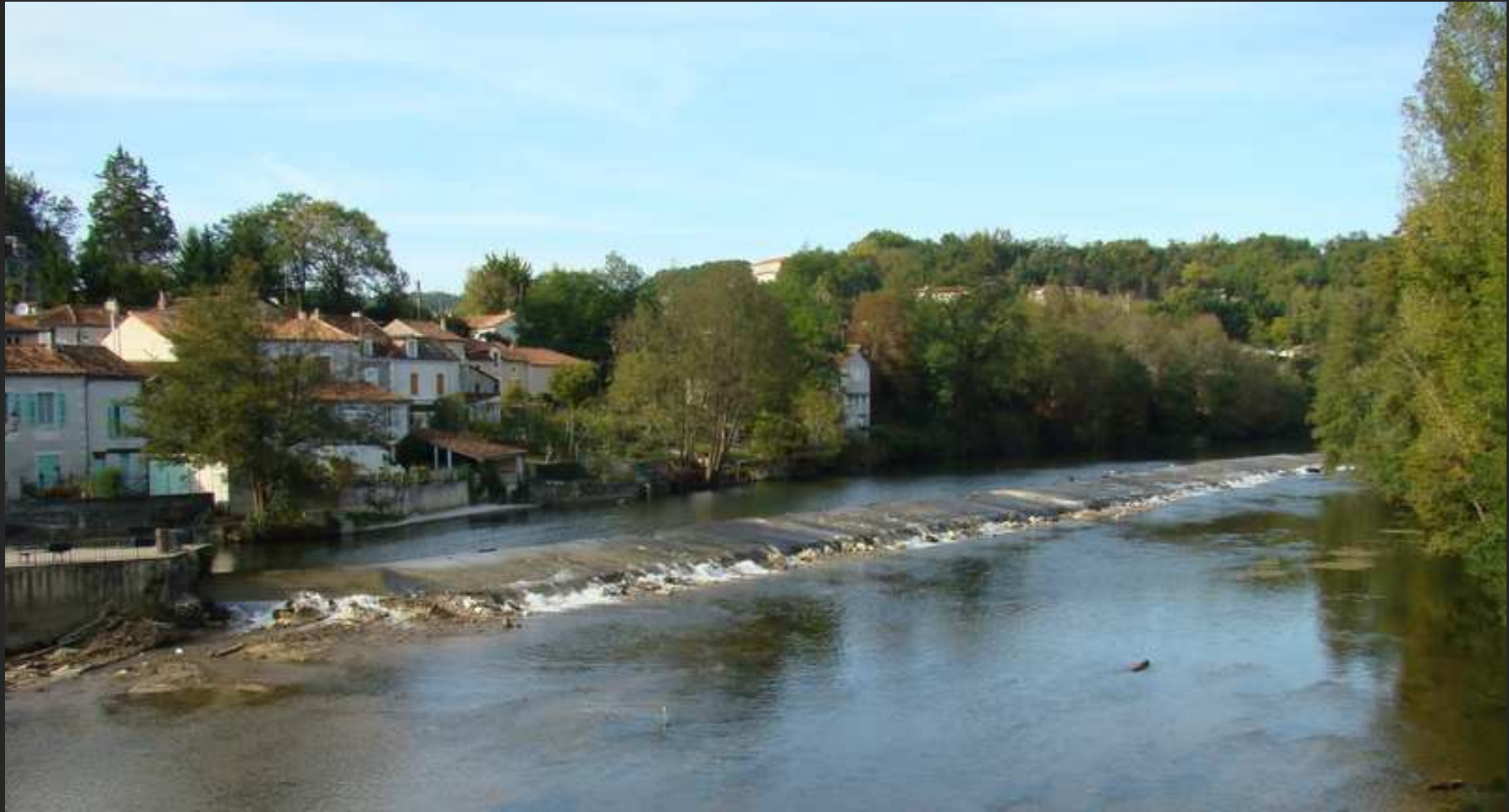
L'Isle à Saint-Astier