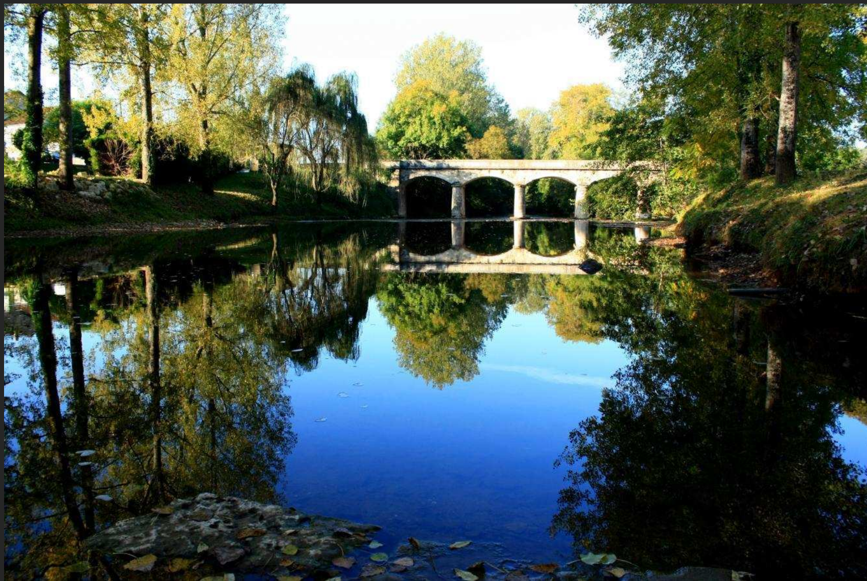
L' Auvézère à Saint-Eulalie d'Ans