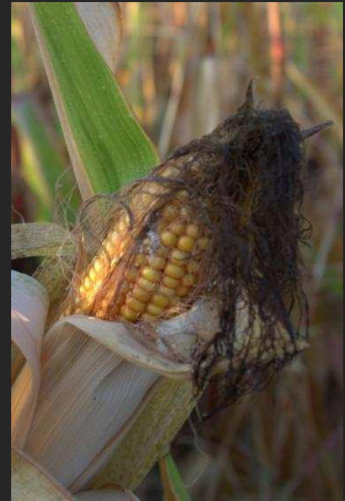
Culture du maïs