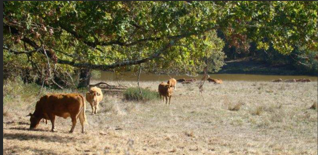
Paysages de la Double