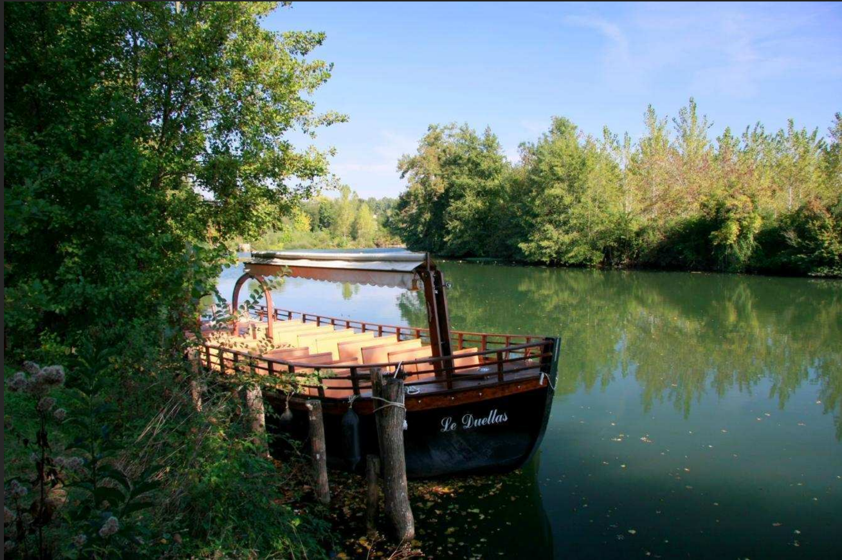
Gabarre à Saint Martial d'Artenset