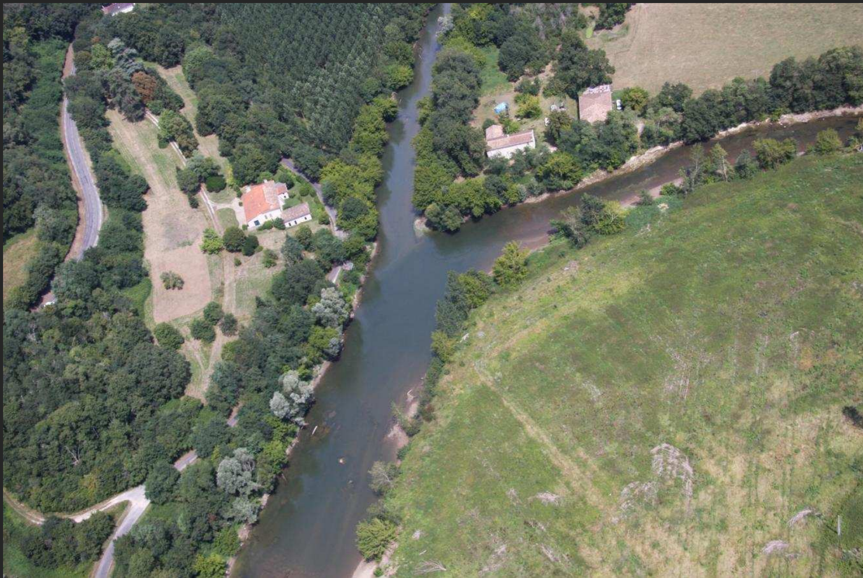
La confluence de l'Isle et de la Dronne