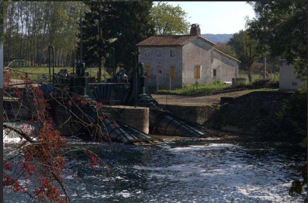
Hydroélectricité à Neuvic